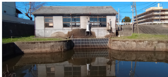
岩崎排水機場を東から見る

(質問) ①市役所周辺浸水被害対策としての岩崎排水機場の現状について②岩崎排水機場にもゴミを取り除く除塵機が必要ではないか。