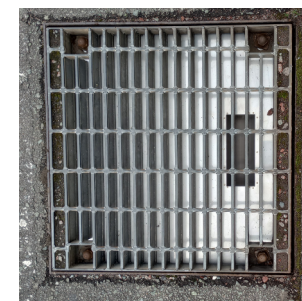
集水桝の中に設置された装置

集水桝内に下水からの異臭が出てこない器具を設置した。雨天時には水の重みで蓋が開いて水を下水管に流す。梅雨時期の効果を確認後、今後の対応を考える。異臭がする箇所は多いので財政面も考慮した上で、特に異臭がひどい箇所から設置を検討していく。